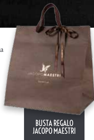
BUSTA REGALO JACOPO MAESTRI

Una busta regalo con panettone classico Jacopo Maestri e una bottiglia di spumante Prosecco è il dono ideale per festeggiare il Natale. Dalle antiche origini milanesi, il panettone è il dolce natalizio a lievitazione naturale tipico della tradizione italiana. Secondo la ricetta ufficiale, è ottenuto da un impasto a base di acqua, farina, burro, uova o anche tuorli, al quale si aggiungono frutta candita, scorzette d'arancio e cedro in parti uguali, e uvetta. L'impasto è lavorato più volte per renderlo soffice e facilitare l'attività dei lieviti selezionati. I processi di lievitazione, cottura e raffreddamento naturale richiedono tempi lunghi e portano a ottenere un prodotto profumato, fragrante e morbido.