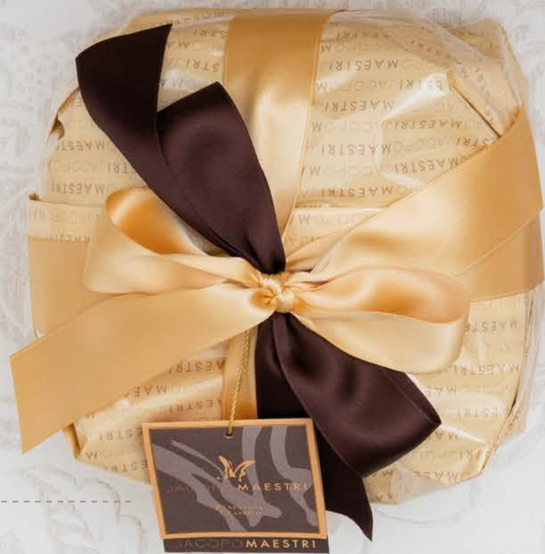
Torroncini assortiti ricoperti al cioccolato Jacopo Maestri 4 gusti assortiti tutti da scoprire

Dalle antiche origini milanesi, il panettone è il dolce natalizio a lievitazione naturale tipico della tradizione italiana. Si suggerisce di servirlo a fette tagliate verticalmente e di accompagnarlo con vino dolce, come lo spumante Brachetto o con delle bevande calde come caffè e cioccolato. Per apprezzarne meglio i profumi e i sapori si consiglia, prima di portarlo in tavola, di lasciarlo riposare a temperatura ambiente per almeno 24 ore.